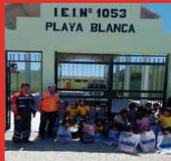
Crübher: Donó Kits escolares para niños de la I.E Playa Blanca