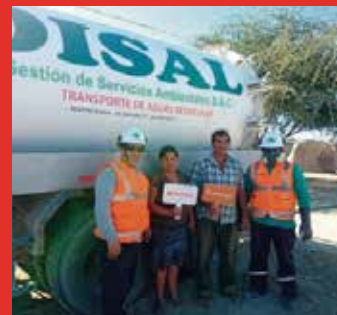
DISAL: Realizó limpieza de Biodigestores en Playa Blanca