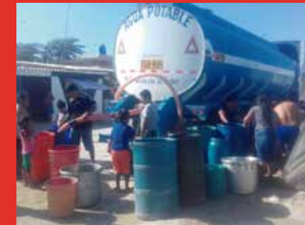
FELÍCITA: Facilitó abastecimiento de agua potable a través de cisternas