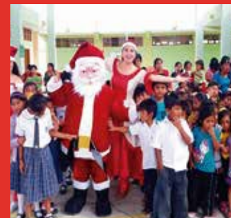
Sodexo: Brindó Chocolatada Navideña para escolares