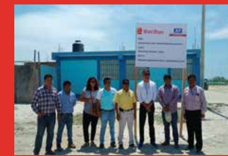
FELÍCITA: Brindó apoyo con maquinaria para el mejoramiento de vías