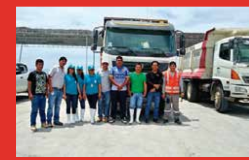
FELÍCITA - GHCOIN: Facilitaron maquinaria para campaña de limpieza