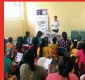
Sodexo: Realizó charla Nutricional para madres